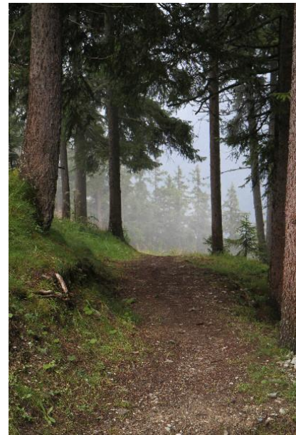
Waldweg (Weg 28)

An der Mittelstation der Finkenberger Almbahnen vorbei geht es weiter nach Westen über einen Fahrweg. In rund 500 m zweigt der Weg 28 dann nach links talwärts ab. Durch den Wald geht es über einen Weg mit Serpentinaen schnell talwärts.