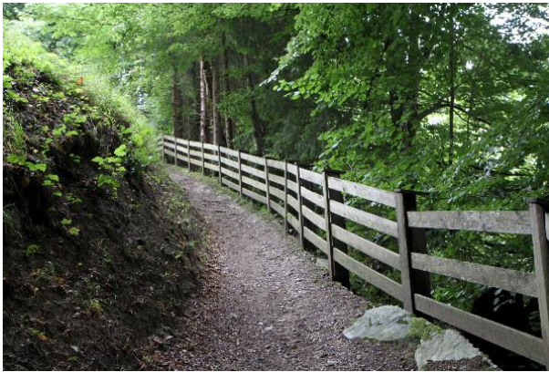
Waldweg (Weg 25)