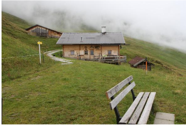
Moorlehrpfad - Alm

Mehr oder weniger hangparallel geht es über Almgelände weiter nach Osten. Im Bereich Neurauf/Talschön geht wieder durch ein wenig Wald.