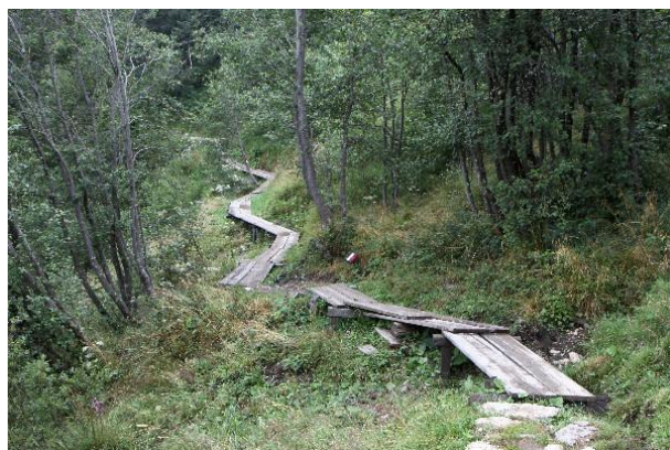
Moorlehrpfad (Weg 55)

Von der Barbarakapelle aus geht es nach Osten den Wiesenhang hinauf. Oben folgt ein Durchgang. Dahinter zweigt der Weg zur Wanglspitze ab, rechterhand beginnt der Moorlehrpfad.