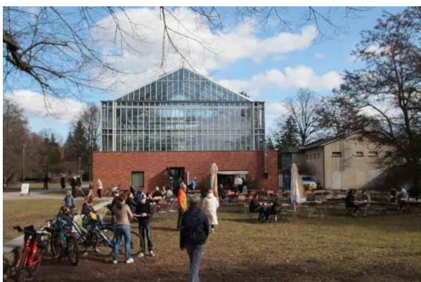
Botanischer Volkspark – Gewächshaus

Hinweis: Wer auch noch das Wildgehege besuchen will. Biegt nicht hinter den Wirtschaftsgebäuden links ab sondern geht noch bis zum nächsten Querweg, Dort dann links und auch hier den zweiten Weg wiederum links, bis man die geologische Wand erreicht hat.