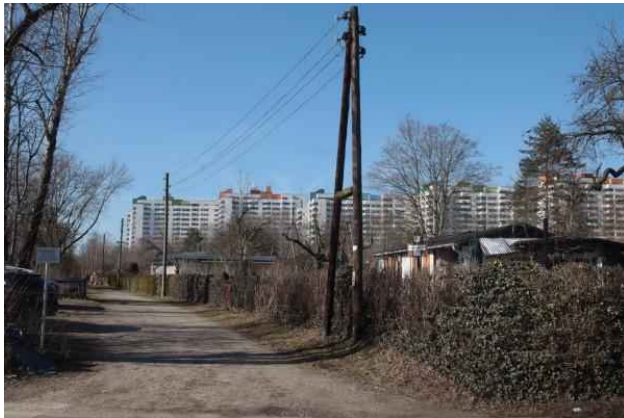
Kleingärten – Blick Märkisches Viertel

krautbahn. Sie wurde 1901 erbaut, heute fährt sie als RB27 ab Berlin-Karow bis in die Schorfheide. Der ursprüngliche Ausgangsbahnhof der Heidekrautbahn war Berlin-Wilhelmsruh – dieser wurde mit dem Mauerbau 1961 gekappt. Nach der Wiedervereinigung ist nun die Reaktivierung möglich geworden. Circa 14 km der Stammstrecke vom Abzweig Schönwalde bis Berlin-Wilhelmsruh mit acht neuen Haltepunkten werden derzeit wiederhergestellt. Eine Durchbindung der Stammstrecke über die Nordbahntrasse bis Berlin Gesundbrunnen ist geplant. Die Bahntrasse dient auch als Gleisanschluß für das Stadler-Bahnwerk.