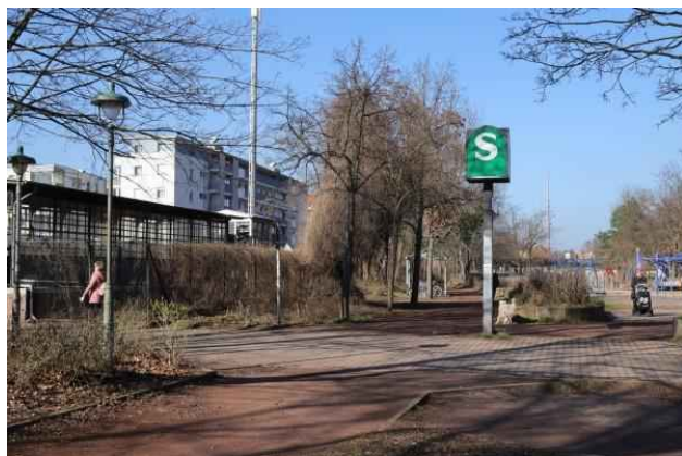
Eschachstraße - Bahnhofsausgang

Eine Wanderung entlang des Nordgrabens und im weiteren Verlauf der Panke. Mit Abstechern zum Rathauspark, dem Botanischen Volkspark und dem Schloßpark Schönholz. Wurde als Wanderung der Gruppe Die Wanderer 25±5km der Sektion Berlin des Deutschen Alpenvereins durchgeführt.