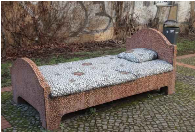
Pocketpark in der Florastraße