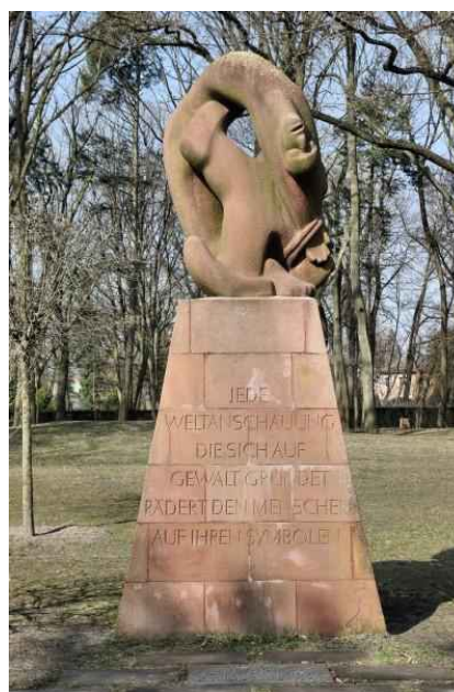
Mahnmal der Gewalt

Es geht über den Kesselpfuhlgraben hinweg und später über die Triftstraße hinweg. Nach rund 125 m biegen wir nach links ab und folgen bald der Straße Am Rathauspark. Linkerhand dann der Thiloweg, an ihm liegt der Friedhof Wittenau (alter Dalldorfer Gemeindefriedhof) mit einer großen Friedhofskapelle von 1907/08.