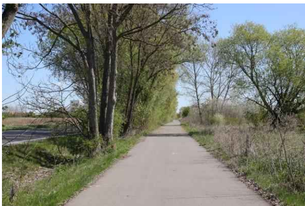
Alte Hirschfelder Straße

Vom Bahnhof aus südostwärts und dann links in die Beiersdorfer Straße. Vor dem Gewerbebau dann rechts in die Alte Hirschfelder Straße. Man erreicht die Freienwalder Chaussee (B158) an einem Verkehrskreisel, wo sich rechts eine Tankstelle befindet. Wir queren die Bundesstraße und folgen der Alten Hirschfelder Straße.