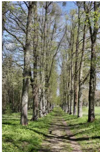
Lindenallee im Gutspark

Hier rechts, am Gutshaus vorbei und dahinter – an der Infotafel - dann links in den Gutspark. Der Gutspark ist ein Park mit Wald und Wiesen, die Skulpturen aus der Zeit von Arnhold sind verschwunden (die Stier-Skulptur steht z. B. in Bad Freienwalde). Der Weg führt uns in einem Bogen nach links, ein Brunnenbecken (Marmorbrunnen) liegt am Wege (außer Betrieb) und eine schöne Lindenallee führt nordostwärts an einem Sportplatz vorbei zur Akazienallee.