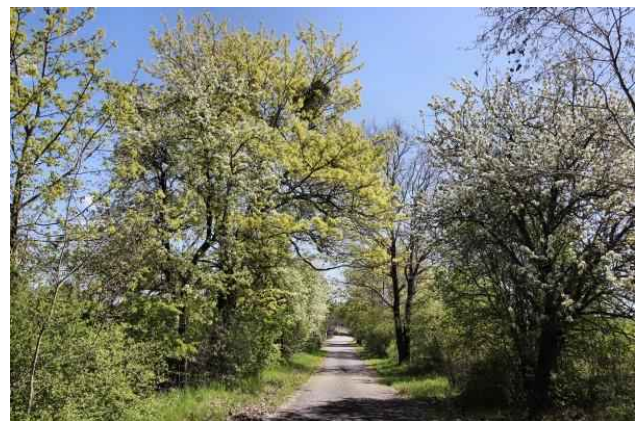
Werneuchener Straße (Obstbaumallee)

Der Weg verläuft schurgerade, es geht auf eine Kuppe hinauf. Auf der rechten Seite kommen wir an ein paar Shelters vorbei. Es geht wieder leicht abwärts. Ein Feldweg zweigt nach links ab und vor uns eine Infotafel. Die Obstbaumallee (Werneuchener Straße) beginnt. Diese Allee wurde 2021 durch Neupflanzungen von Obstbäumen wieder vervollständigt. Diese Allee ist im Frühjahr zur Zeit der Baumbüte sehr reizvoll, ebenso im Herbst, wenn das Obst reif ist und auf die Ernste wartet bzw. als Fallobst aufzulesen ist.