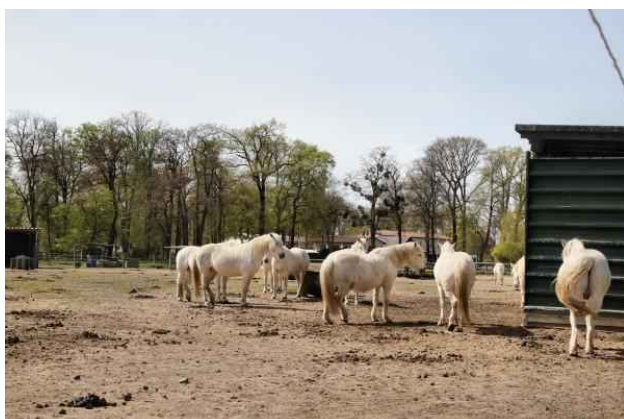
Camarque-Hof - Pferde

Wir umrunden die Kirche. Nördlich von ihr ein kleiner Dorfteich (trockengefallen), am neuen Bürgerhaus vorbei über Am Dorfanger südwärts und links in die Dorfstraße. Vorbei am rechts liegenden ehemaligen Gutshaus geht es dann nach 100 m rechts in die Mühlenstraße. Wir kommen zum Camarque-Hof, einem Reiterhof. Auf der Pferdekoppel eine große Anzahl von Schimmeln.