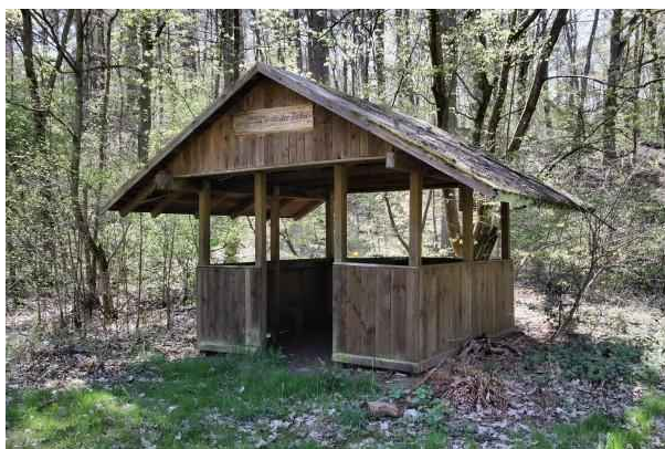
Schutzhütte „An der Fichte“

Der Gamengrund ist eine glaziale Rinne (300 bis 400 m breit). Sie verläuft von Eberswalde bis Hirschfelde. Seine Senken sind abflußlos. Weiter südlich durchfließt dann das Fredersdorfer Mühlenfließ den Fängersee und entwässert zur Spree.