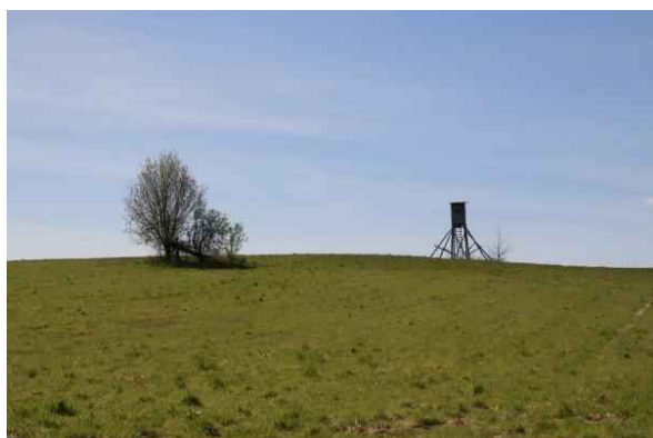
Hügel mit Hochstand

rand. Hier folgen wir dem Feldweg am Waldrand nach links. Nach Westen blickend, sehen wir hier Hochstände oben auf dem Hügel.