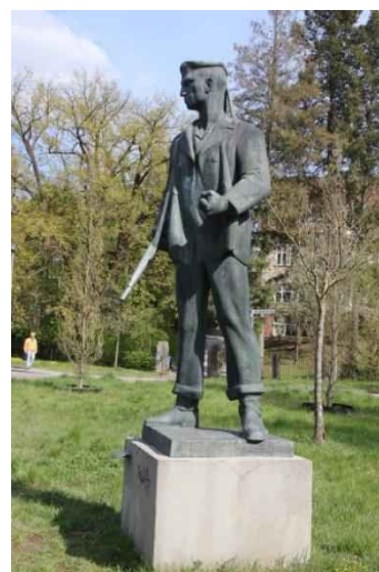
Statue Roter Matrose

Am Josef-Zettler-Ring erblicken wir die Skulptur des „Roten Matrosen“. Geschaffen von Hans Kies, erinnert an den „Kieler Matrosenaufstand 1918“. Die Skulptur ist eine Zweitanzfertigung, das Original steht auf dem Friedhof der Märzgefallenen im Volkspark Friedrichshain.