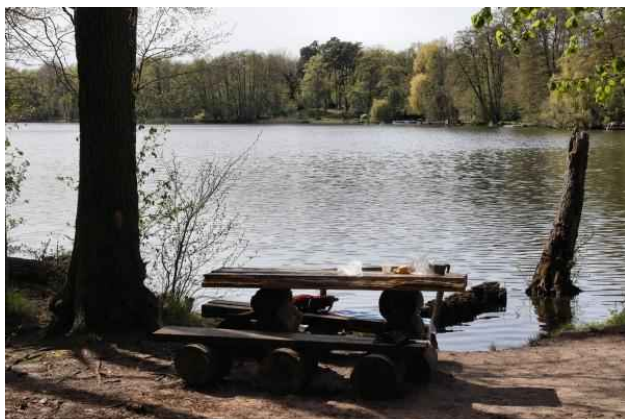
Rastplatz am Bötzsee

Ein Wasserlauf wird gequert und der Spitzmühlenweg geht den Hang hinauf. Wir biegen gleich rechts ab und folgen dem Waldweg der schnell zum Uferweg am Bötzsee wird. Keine 200 m und ein Rastplatz mit schönem Ausblick auf den Bötzsee ist erreicht.