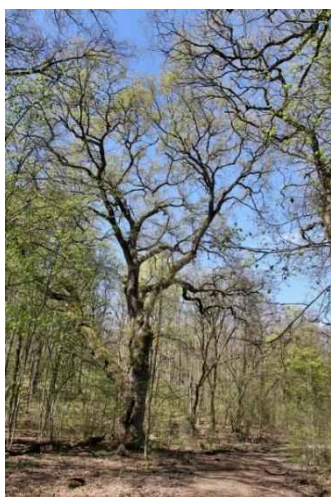
Im Gamengrund (Naturdenkmal)

Der südwärts verlaufende Weg führt auf den Wald zu. Hier geht es links ostwärts in den Wald. Es geht erst eben, dann abfallend in den Gamengrund hinunter. Im Gamengrund treffen wir auf den nord-südlich verlaufenden Wanderweg, u. a. der 66-Seen-Weg. Auf ihm weiter südlich.