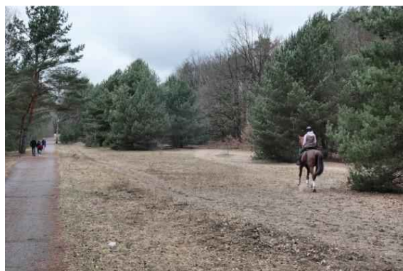
Berliner Mauerweg (Kolonnenweg)

Wieder zurück zum Berliner Mauerweg. Es geht weiter nordwärts und nach wenigen Meter ist das Tegeler Fließ erreicht, das hier die Grenze zwischen Berlin und Brandenburg bildet. Jenseits des Fließes geht wieder etwas hinauf. Rechterhand ein Pferdehof mit zahlreichen Pferden auf der Koppel, hier biegen wir nach links ab und folgen dem alten Kolonnenweg (Berliner Mauerweg oder auch Rundweg Eichwerder Moorwiesen). Der Bereich der Eichwerder Moorwiesen ist ein seltener Lebensraum und als Europäisches Schutzgebiet ausgewiesen. Es geht durch eine sandige Gegend, rechts ansteigend mit vielen offenen Sandflächen, links ein Gehölzstreifen, hinter dem sich die Fließwiesen verstecken.