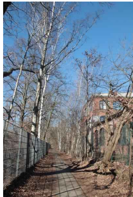
Mauerweg an der Nordbahn

kow-Park dann links über die Trasse der Heidekrautbahn und dem Weg am Bahndamm der Nordbahn weiter folgen. Hinweis: Durch die Bauarbeiten bzw. nach Fertigstellung der Heidekrautbahn kann sich die Wegeführung in Zukunft verändern! Es geht auf Weg zwischen Bahndamm und Industriegebiet weiter nordwärts. Bald beginnt das Gelände des Bahnbauers Stadler. Auf Höhe der Bahnbrücke (Durchgang zum Interessentenweg) finden sich am Werksgelände von Stadler etliche Graffitimalereien von den hier produzierten Bahnen und von Berliner Motiven.