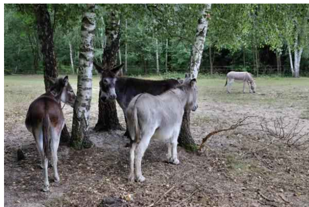
Esel am Eichwerder

Ein Stück weiter westlich biegt der Weg nach Süden ab, wir kommen in den Erlenbruchwald der Eichwerder Moorwiesen. Der Boden ist hier sumpfig (nach Wiedervernässung) und so wurde der Weg als Moorsteg erbaut. Nach diesem Niedermoorbereich erreichen wir wieder trockenes Land. Der Eichwerder ist erreicht, ein Sandinsel im Fließtal, die früher mit Eichen bewachsen war. Hier hat man eine Eselweide eingerichtet, im Sommer grasen hier Esel und pflegen die Landschaft.