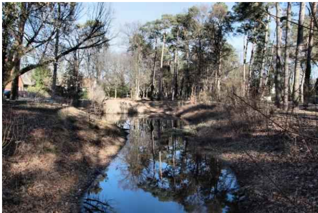
Edelteich - Regenwasserbecken

des Regenwassers, da Teile Frohnaus keine Regenwasserkanalisation haben. Die Niederschläge werden in diese Senken abgeleitet, wo die dann versickern. Am Katzensteg liegt oberhalb des Edelteiches eine Sitzgruppe (Rotunde). Dieser Bereich wurde rekonstruiert und war ein Beitrag Frohnaus zur Internationalen Gartenausstellung (IGA) 2017, die in den Gärten der Welt (Marzahn) stattfand.