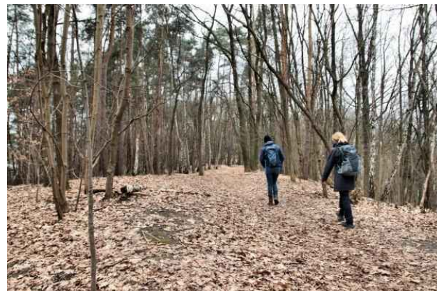
Waldstreifen Oranienburger Chaussee

Der Fürstendamm ist ein künstlicher Durchstich durch einen Höhenzug. Er wurde im Zuge der Besiedlung der Gartenstadt Frohnau angelegt. Im Bereich des Durchstichs wurde dann eine Brücke erbaut, die aber 1944 abbrannte. Das nördliche Widerlager (Transformator) blieb erhalten und wird als Weinrestaurant und für Ferienwohnungen genutzt.