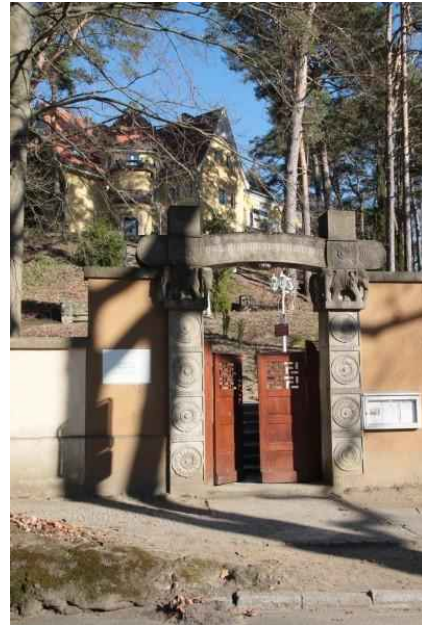
Das Buddhistische Haus - Elefantentor