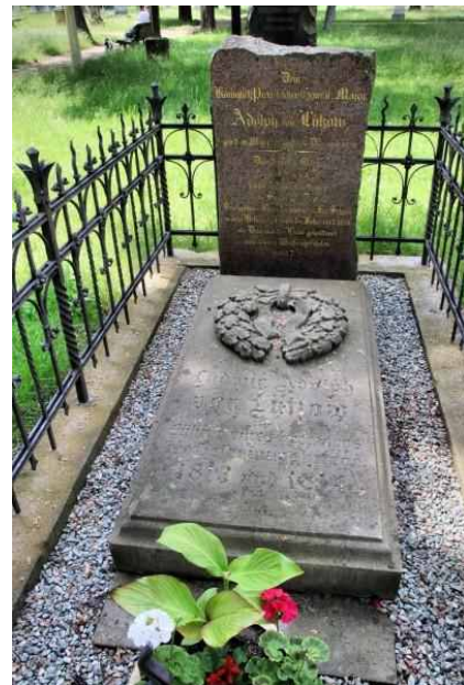
Garnisonfriedhof – Grab Lützwow

Der Garnisonfriedhof bestand von 1705 bis 1867, für Offiziere noch bis 1951. Er ist der älteste Militärfriedhof Berlins. Wir folgen vom Eingang dem Weg auf den Friedhof. In der Südostecke ein Denkmal für die Opfer der Straßenkämpfe des 2. Weltkrieges mit Massengräbern dahinter. Weiter dem Weg folgend geht es in die Nordostecke. Hier ein gitterumrandetes Grab. Ludwig Adolph Wilhelm Freiherr von Lützwow, Führer des Freikorps der „Schwarzen Jäger“ im Befreiungskrieg 1813-15 liegt hier.