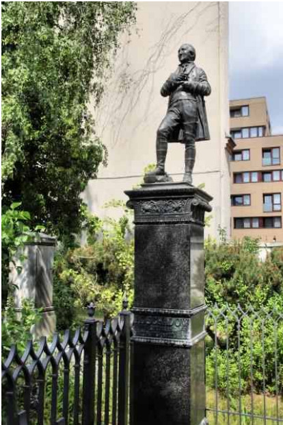
Dorotheenstädtischen Friedhof - Schadow