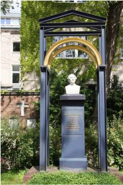
Dorotheenstädtischen Friedhof – Stüler