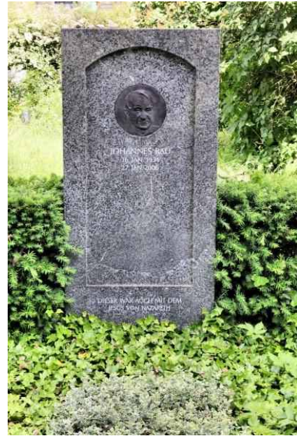
Dorotheenstädtischen Friedhof - Rau