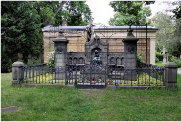
Sophienfriedhof – Grabstätte Bechstein

Wir betreten den Friedhof, der seit 1872 besteht. An ersten Weg rechts und die Grabstätte des Komponisten Walter Kollo ist erreicht. Ein Stück weiter die Gräber des Komponisten und Dirigenten Albert Gustav Lortzing sowie des Cembalisten Wilhelm Bach, ein Enkel von Johann Sebastian Bachs, der Kapellmeister bei Königin Louise und Musiklehrer ihrer Kinder war.