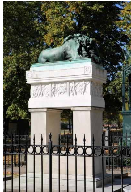
Invalidenfriedhof - Scharnhorstgrab

Die Scharnhorststraße ist erreicht. Hier links und dann rechts in den Invalidenfriedhof. Der Friedhof besteht seit 1748 und ist damit der zweitälteste Militärfriedhof Berlins, er wurde 1951 geschlossen. Zu Mauerzeiten war er zudem unmittelbares Grenzgebiet, zum Kanal hin stehen noch Teile der Hinterlandmauer. Nach den Befreiungskriegen 1813-15 erfolgte ein Ausbau zur Gedächtnisstätte preußisch-deutscher Geschichte.