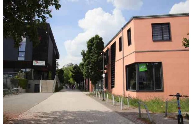
Vereinszentrum DAV Sektion Berlin

Wir queren die Lehrter Straße und später die Seydlitzstraße. Weiter nordwärts zwischen den Häusern hindurch und das Ziel der Wanderung – Vereinszentrum und Kletterzentrum – ist erreicht, wo das Sommerfest schon im Gange war.